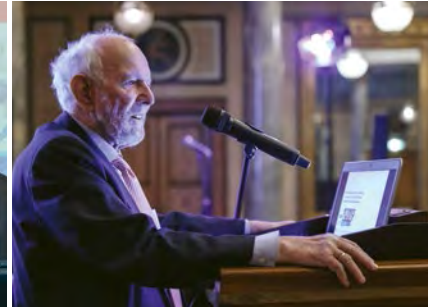
Prof. Dr. Ernst Ulrich von Weizsäcker (Ehrenpräsident des Club of Rome) 2023